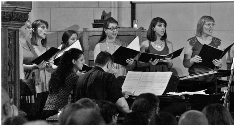
Conciertos de Adviento