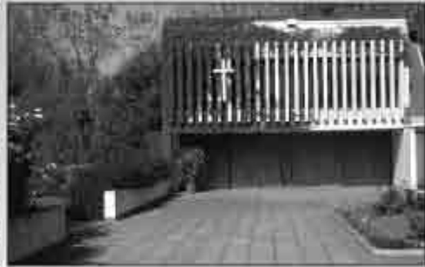
Capilla Pablo Nogués